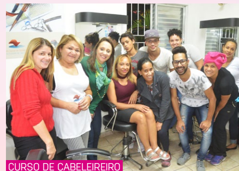
CURSO DE CABELEIREIRO