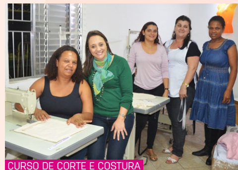
CURSO DE CORTE E COSTURA