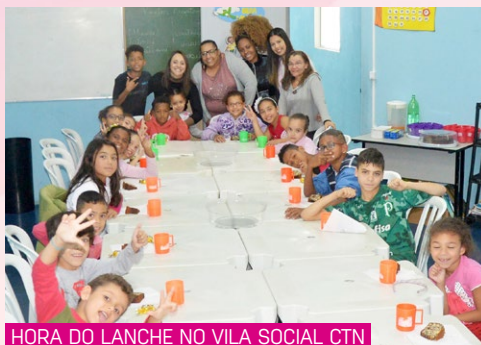
HORA DO LANCHE NO VILA SOCIAL CTN