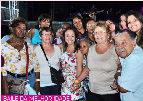
BAILE DA MELHOR IDADE