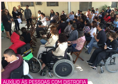
AUXÍLIO ÀS PESSOAS COM DISTROFIA