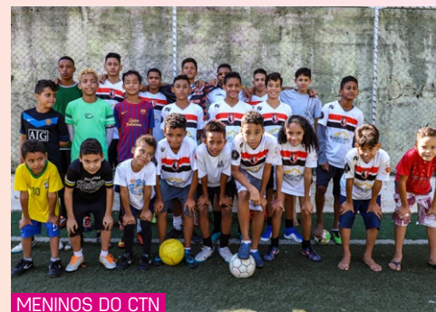
MENINOS DO CTN