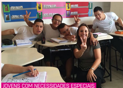
JOVENS COM NECESSIDADES ESPECIAIS