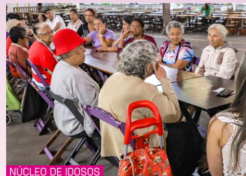
NÚCLEO DE IDOSOS