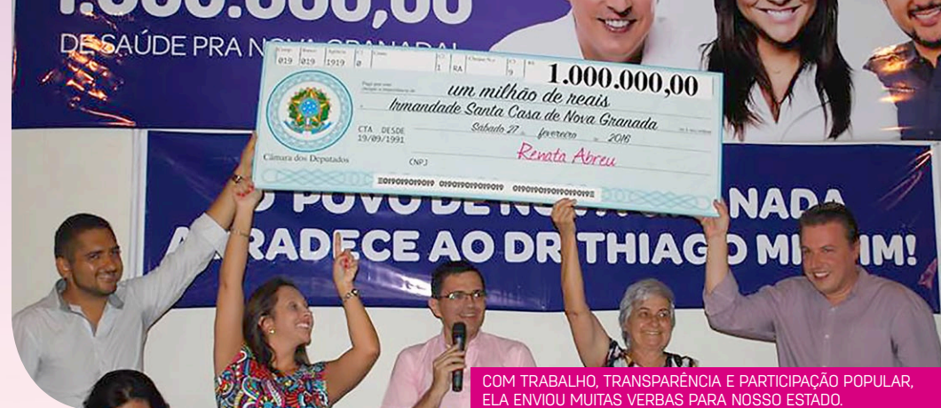
COM TRABALHO, TRANSPARÊNCIA E PARTICIPAÇÃO POPULAR, ELA ENVIU MUITAS VERBAS PARA NOSSO ESTADO.

Neste segundo mandato, os canais de interação aumentaram. Hoje, ela bate-papo em transmissões ao vivo pelas redes sociais, apresenta o Resumo da Semana, traz sempre um tema de destaque para que o cidadão se manifeste por meio de enquetes. E mais: em seu site o cidadão tem acesso a gastos de gabinete, votações, discursos e muito mais. É só clicar ( www.renataabreuoficial.com.br ).